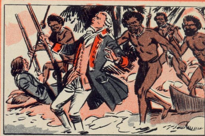
3. — COOK