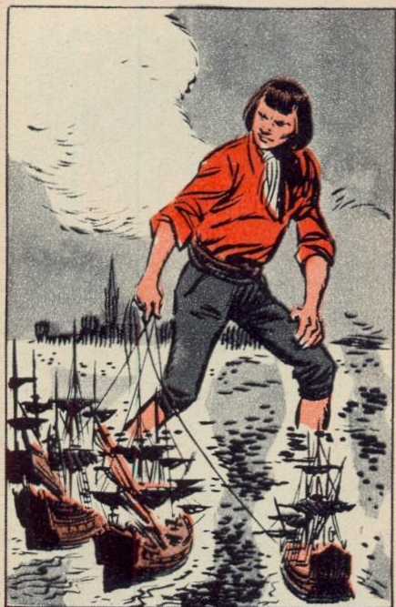
1. — AVONTUREN

DE interessantste Engelse ontdekkingsreiziger van de XVIII e eeuw was ongetwijfeld James Cook. Drie maal trok hij er op uit en ontdekte een groot aantal eilanden van Oceanië, o.m. Nieuw Caledonië en Polynesië. Tenslotte landde hij op de Hawaii eilanden. Het is daar, in de baai van Kealakekona dat hij in 1779 door de inboorlingen gedood werd. Met Cook begon het tijdperk van de wetenschappelijke ontdekkingsreizen.