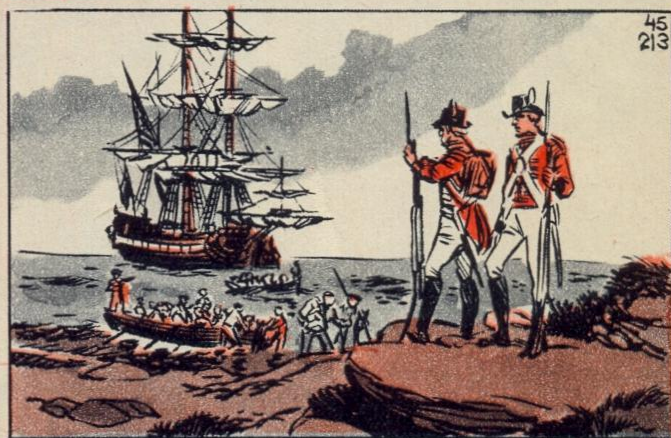
5. — AUSTRALIE

DE Deen Bering ontdekte de doorgang tussen het uiterste punt van Alaska en Azië. De Rus Tsjelloeskine ontdekte de meest noordelijk gelegen kaap van Amerika. De Schot Mackenzie bereikte de stroom die zijn naam draagt. Aan het andere eind van de wereld verkende de Engelsman John Byron de Zuidelijke zeeën. De Fransman Bougainville deed de reis rond de wereld. Hij kwam op de Nieuwe Hebriden, op Samoa en Tahiti.